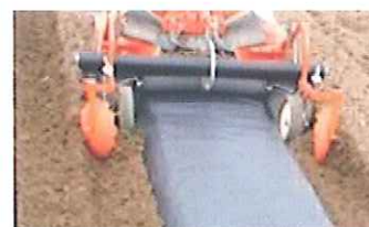
マルチャーでの展張